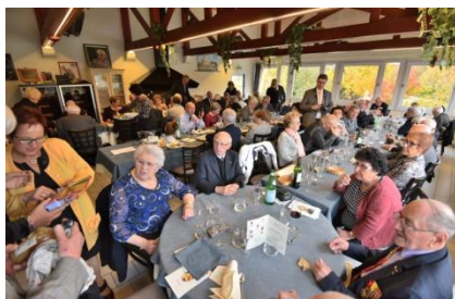
Restaurant le Bateau Lavoir